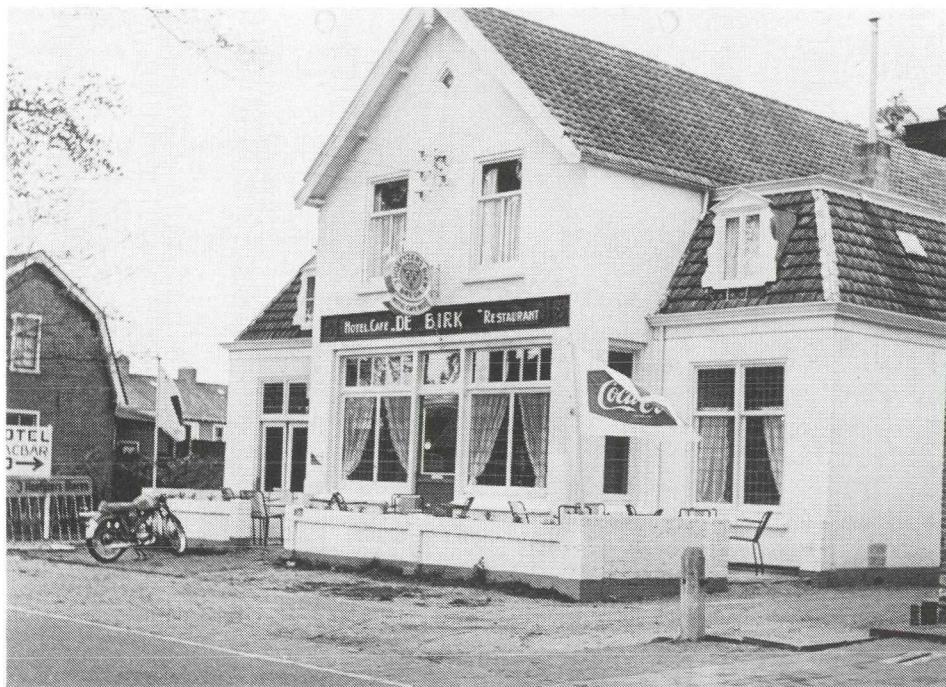
Café "Du Passage", later Hotel Café "De Schouw" en tenslotte Hotel Café "De Birk".

De oudere generatie in Soest weten nog dat "De Schouw" in de laatste oorlogsjaren gevorderd is geweest door Duitse soldaten. Vlak na de oorlog toen nog maar weinig mensen een televisie bezaten kon men in een hoekje van "De Schouw" voor twee kwartjes 's avonds naar de zwart/wit programma's kijken.