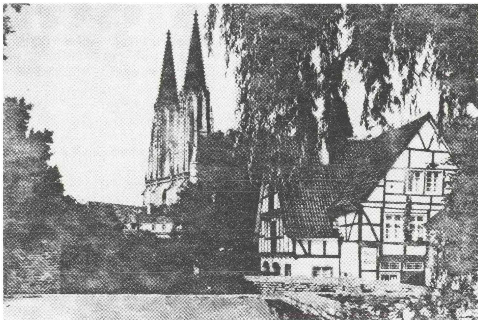
Soest in Westfalen: De "Große Teich" met de "Wiesenkirche".

te onder andere de volgende, het overheidsstandpunt ondersteunende, standpunten: "Gemakkelijk is het de toegestoken hand te weigeren en neen te zeggen. De hand wel te drukken is een bewijs van zedelijke moed. Het drukken van die hand is nodig om de jeugd bij elkaar te brengen en te leren beseffen dat de jaren 1940-1945 niet mogen terugkeren."