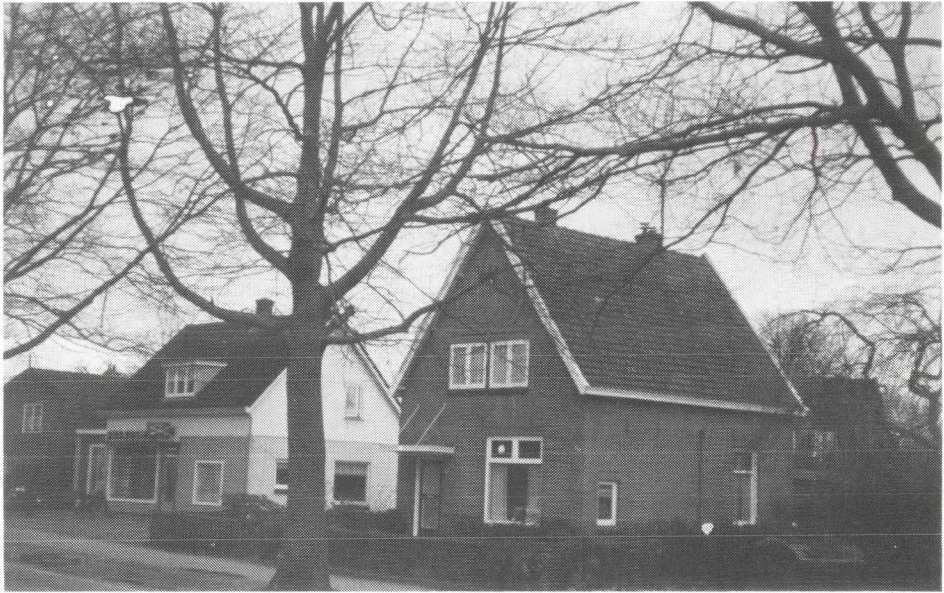
Huis Soesterbergsestraat 50.

Nummer 50 was al voorzien van electra, water en gas, het laatste nog met een gasmeter, waar dubbeltjes in gingen een z.g. "Doordraaiër" zodat de muntjes na een draai aan een wiel en telling door de meter, weer gebruikt konden worden. Het toilet had nog geen waterspoeling, men moest een kan met water gebruiken en bij strenge vorst kon de afvoer bevriezen, waarna met ketels kokend water geprobeerd moest worden om alles te ontdooien.