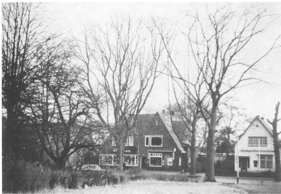
Tegenover Soesterbergsestraat 50 de winkel van "Nilson".

houden, allerlei planten zoals eenjarige papaver en springbalsemien laten groeien of een kuil graven, die op een diepte van 1,20 meter al het grondwater bereikte.